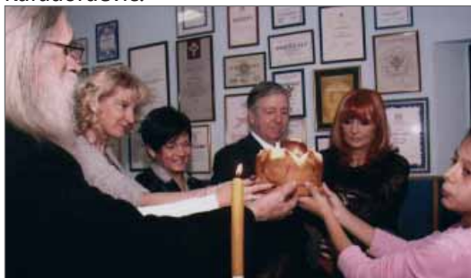
Triglav Kopaonik domaćin slave Sveti Sava

► Ove godine Triglav Kopaonik odlučio je da obraduje mališane u Osnovnoj školi „Duško Dugalić“ i bude domaćin školske slave Sveti Sava. Znajući koliko je tradicija važna, a svaka pomoć dobrodošla, Triglav Kopaonik je još jednom pokazao svoje veliko srce. Predstavnici Triglava koji su odneli slatkiše i proveli Svetog Savu sa ovim mališanima, uživali su u njihovim osmesima i iskrenoj dečjoj radosti. Proslavi je, pored kolega iz Triglav Kopaonika, prisustvovao i prestolonaslednik Aleksandar Karađorđević.